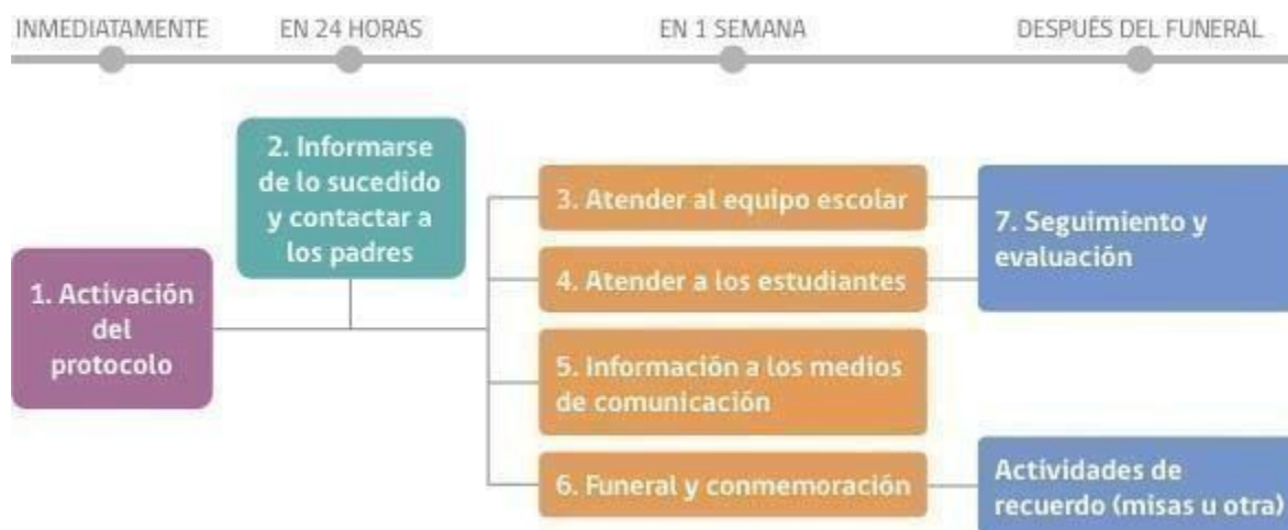
Diagrama de siete pasos que se deben seguir tras la muerte por suicidio de un estudiante